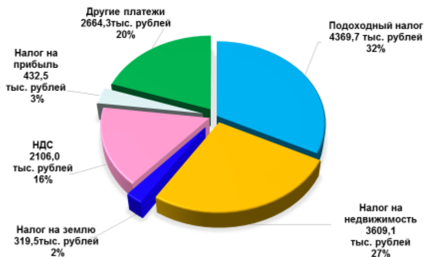
СТРУКТУРА СОБСТВЕННЫХ ДОХОДОВ БЮДЖЕТА РАЙОНА ЗА 2019 ГОД

По состоянию на 01.01.2020 г. задолженность по платежам в бюджет составила 204,7 тыс. рубля и уменьшилась по сравнению с началом года на 88,9 тыс. рубля.